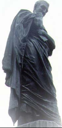
Abb. 1 Ovids Statue in Sulmona

Publius Ovidius Naso wurde am 20. März 43 v. Chr., dem Todesjahr Ciceros, als Sohn eines adeligen Ritters in Sulmo, dem heutigen Sulmona, geboren. Er ist der erste Poet, von dem wir eine Autobiographie besitzen.