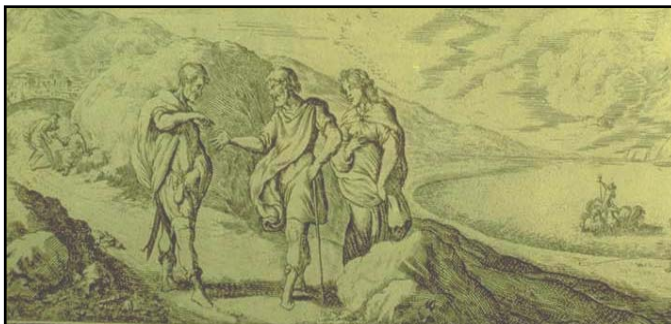
Abb. 6 Erysichthon verkauft seine Tochter - im Hintergrund ist Nep- tun zu sehen;

Wie schon zu Beginn erwähnt, ist die Bestrafung des Erysichthon wegen seines Frevels auf jeden Fall gerecht vollzogen worden und der Mann hat auch die Grausamkeit, die dabei angewendet wurde, regelrecht verdient. Bei so einem Menschen eine Entschuldigung zu suchen ist zwecklos. Ähnlich wie Lykaon schreckt Erysichthon vor grundloser Brutalität nicht zurück. Wir als Leser erfahren aus Ovids Text nicht warum er überhaupt den heiligen Baum fällen wollte. Mir erscheint es eher als unglaubwürdig, dass er diese eine Eiche bloß des Holzes wegen umgeschlagen hat; dazu hätte er jeden anderen Baum nehmen können. Wir können nur vermuten, dass er so gehandelt hat, um den Göttern, in diesem Fall der Göttin Ceres, zu trotzen. Sein unermesslicher Übermut kostet ihn das Leben und dabei steht der Leser sicherlich nicht auf Erysichthons Seite, da er sich in den Augen aller Außenstehenden niemals so verhalten hätte dürfen.