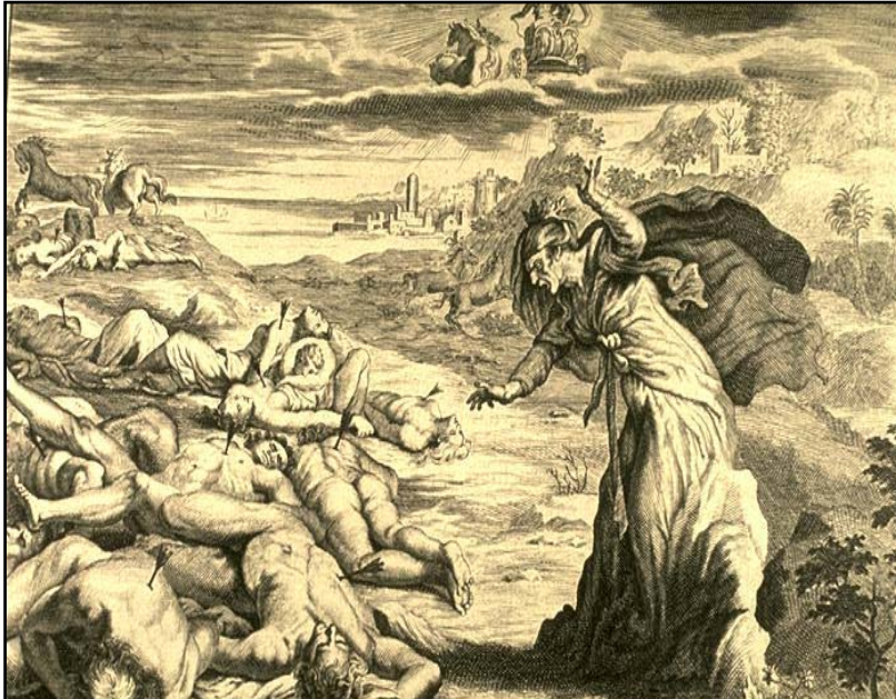
Abb. 4 Niobe vor ihren getöteten Kindern

Apoll und Diana richten unter den vierzehn Nachkommen der Niobe ein grausames Massaker an, welches von Ovid genau beschrieben wird. Mit jedem Kind, das der Königin von Theben genommen wird, scheint die Stolze schwächer und unglücklicher zu werden. Niobe weint um ihre tote Familie (ihr Mann hat aus Trauer um seine sieben Söhne Selbstmord begangen) und wird zuletzt noch selbst bestraft: Sie wird versteinert - in ein Gebirge verwandelt.