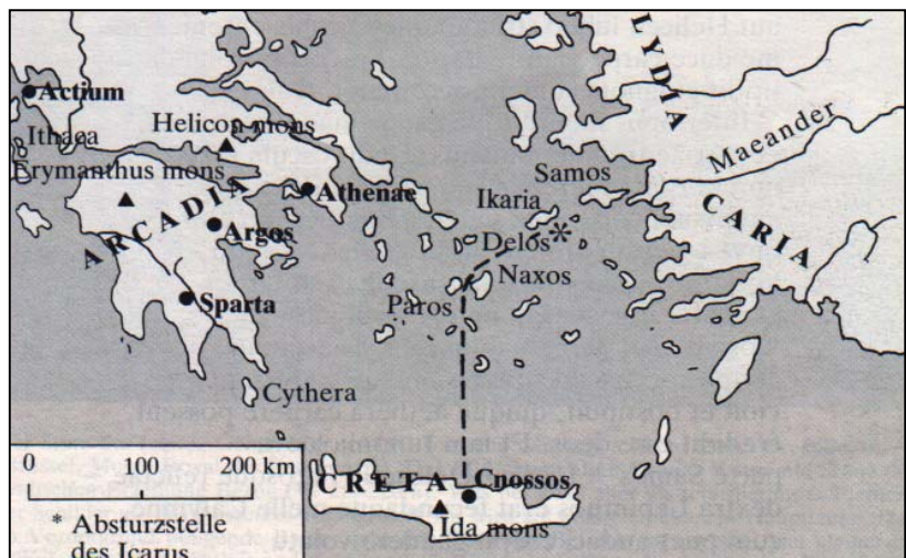
Abb. 7: Flugroute von Dädalus und Ikarus

Der Junge findet Gefallen an der Fliege- rei, möchte dem Himmel noch näher kommen und verlässt so seinen Vater. Doch er kommt der Sonne zu nahe, die das Wachs, welches die Federn seiner Flügel zusammenhält, schmelzen lässt. Ikarus verliert seine Flugfähigkeit und stürzt