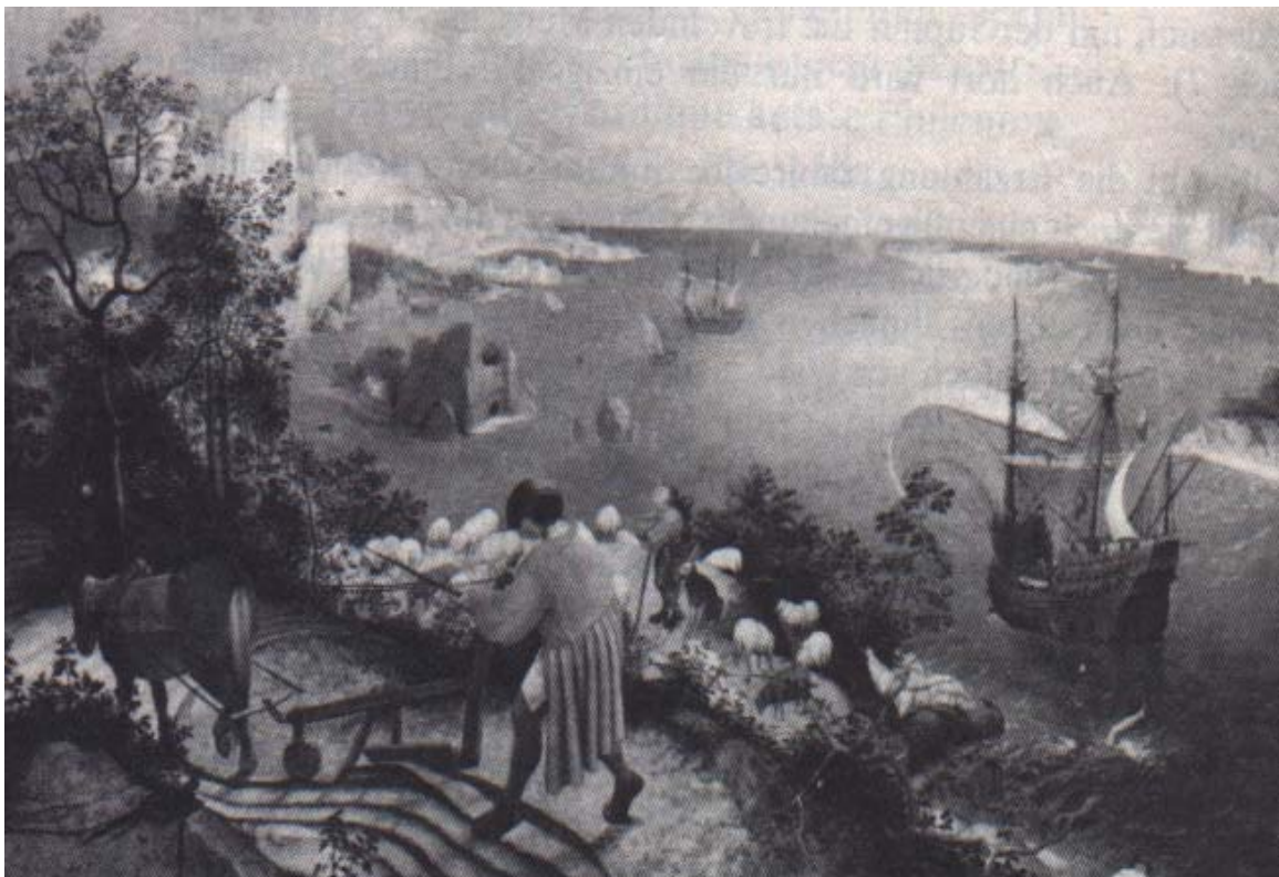
Abb. 8: Der Sturz des Ikarus; Gemälde um 1558 von dem flämischen Maler Pieter Breughel d. Ä.

Wie wir wissen, war es in der Antike den Menschen nicht erlaubt sich mit den Göttern auf gleiche Stufe zu stellen, und so ein Verhalten musste bestraft werden. Wir erfahren aber nicht genau von welchem Gott oder von welchen Göttern genau die Erniedrigung des Ikarus ausging, können aber auch nicht mit Gewissheit sagen, dass ein Himmelsbewohner dafür verantwortlich ist, da die Bestrafung ähnlich wie bei Midas eigentlich nur passiv ausfällt. Die Frage nach der strafenden Gottheit bleibt also unbeantwortet und wir müssen uns damit begnügen, die Götter hier allgemein mit einem Wort zu betrachten.